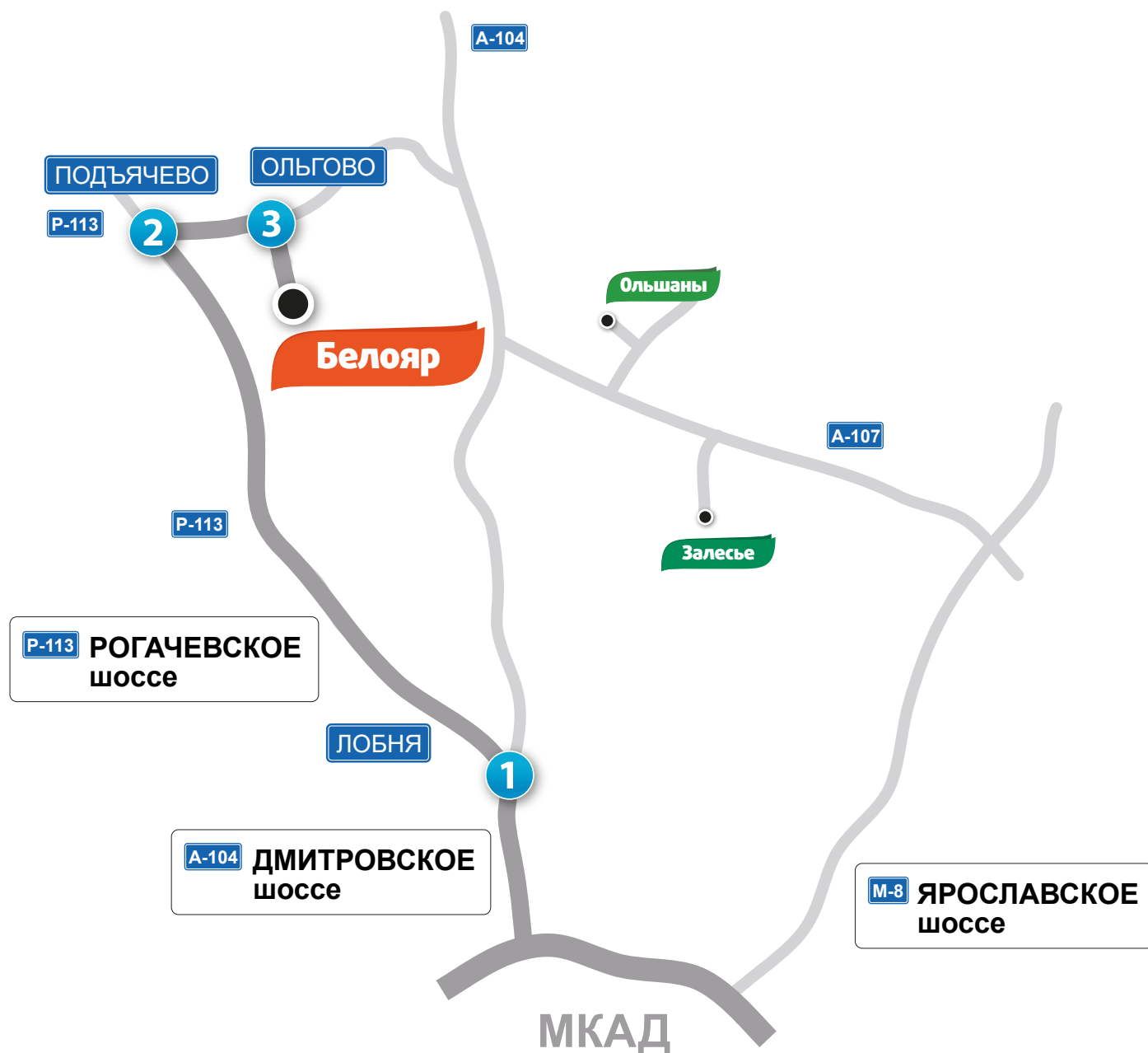
Схема проезда до посёлка Белояр по Рогачевскому шоссе